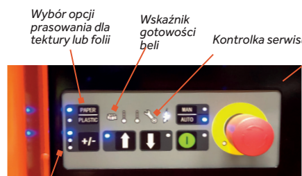
Wybór rozmiaru beli

Bele o wadze do 250 kg są łatwo wyjmowane, dzięki funkcji półautomatycznego wyrzutu.